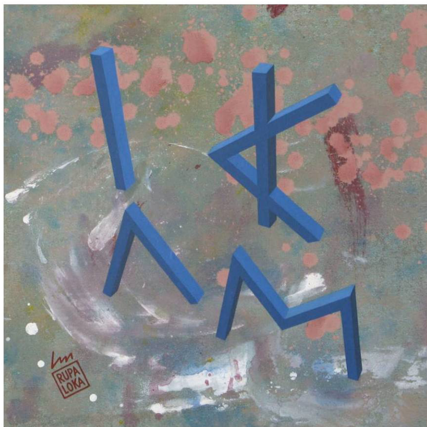
RUPALOKA, Alfabeto ionico IOTAKAPPALAMDAMU acrilico su tela su masonite, 35 x 35 h (cornice 47 x 47 h) Sant'Albano Stura, aprile 2012, RPL-015