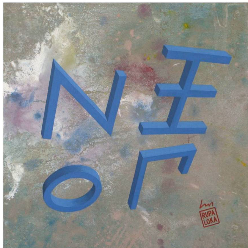
RUPALOKA, Alfabeto ionico NUXIOMICRONPI acrilico su tela su masonite, 35 x 35 h (cornice 47 x 47 h) Sant'Albano Stura, aprile 2012, RPL-016