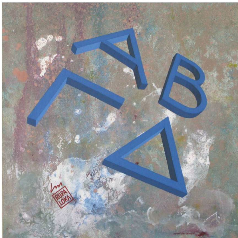
RUPALOKA, Alfabeto ionico ALFABETAGAMMADELTA acrilico su tela su masonite, 35 x 35 h (cornice 47 x 47 h) Sant'Albano Stura, aprile 2012, RPL-013