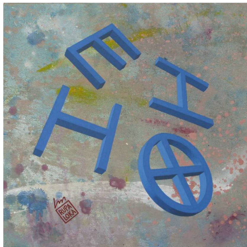
RUPALOKA, Alfabeto ionico EPSILONZETAETATETA acrilico su tela su masonite, 35 x 35 h (cornice 47 x 47 h) Sant'Albano Stura, aprile 2012, RPL-014